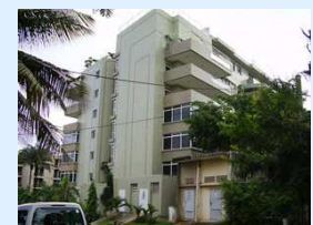
Résidence SANTA MARIA